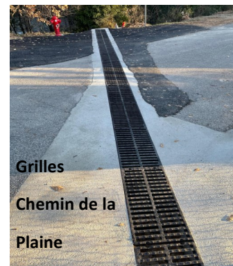
Grilles Chemin de la Plaine