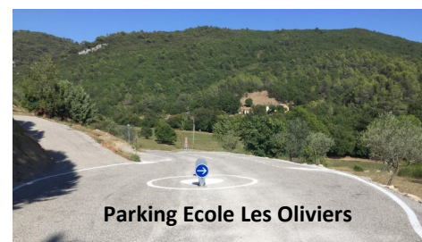
Parking Ecole Les Oliviers