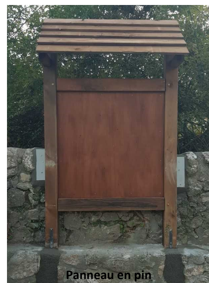
Panneau en pin