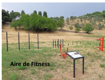
Aire de Fitness