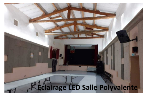
Eclairage LED Salle Polyvalente