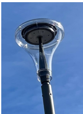
Nouveaux éclairages Led